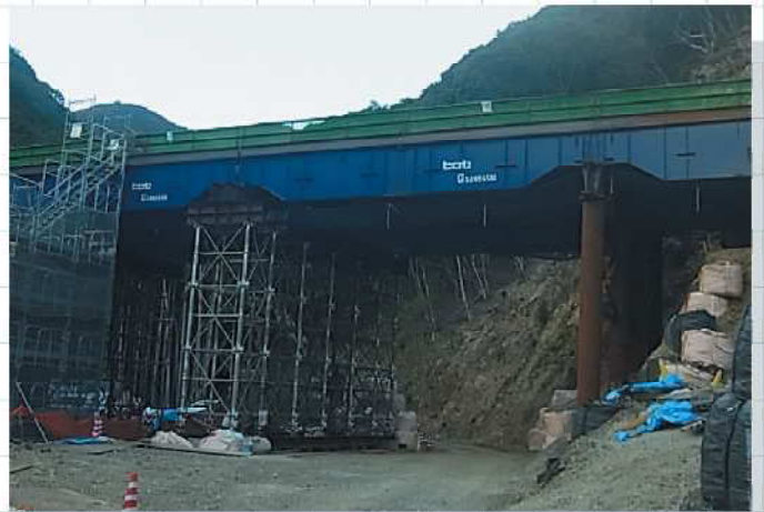
現場名 近畿自動車道紀勢線見老津トンネル工事 特長 RoRo支柱下部は直接基礎形式(地盤改良) Hi-RoRo工法+Hi-BRIDGE工法組合せ

施工場所(山岳・河川)、時期(湧水期・通年)、重機選定等、 現場条件に合わせて、最適な提案いたします。まずは、ご相談ください。