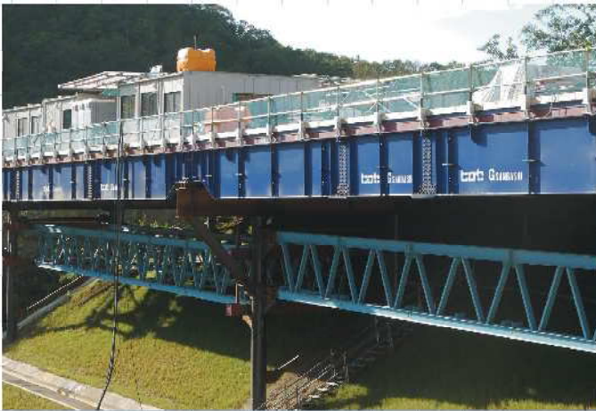
現場名 新名神高速道路 東畦野トンネル工事仮橋F 特長 横架設 最大スパン30m