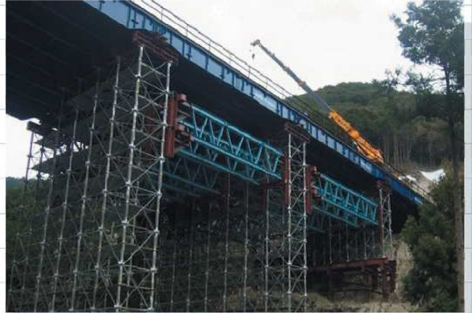
現場名 近畿自動車道紀勢線と深川地区改良工事 特長 縦架設 最大スパン18m

上部工にG栈橋®、下部工にはパイプ支柱のRoRo支柱を使用した栈橋です。上/下部工をユニット架設する事で工期短縮を実現し、また縦架設にも対応します。