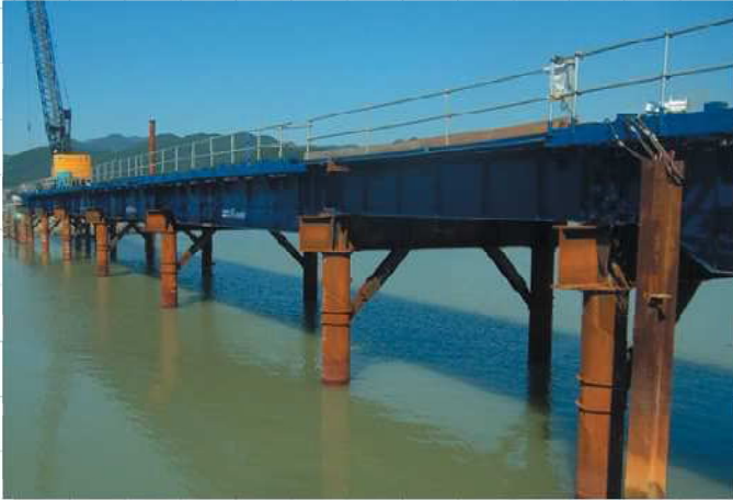
現場名 熊野川下流部河道浚渫工事 特長 縦架設 最大スパン16m 通年存置

上部工にG栈橋®、下部工には鋼管を使用した栈橋です。杭本数を大幅に削減し、上/下部工プレスユニット架設する事で工期短縮を実現し、また縦架設にも対応します。