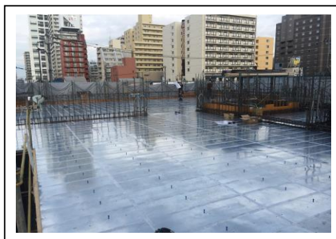
<事例2> 1スラブ10m×17mの大スラブ対応