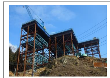
高速施工栈橋シリーズ (ヒロセ)