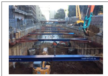
ヒロセツインビーム® (ヒロセ)