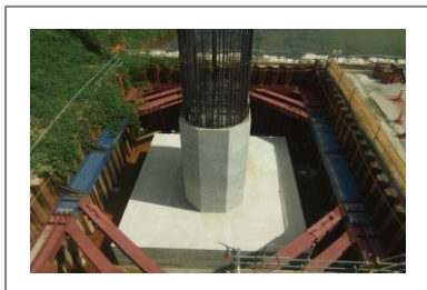
ヒロセメガビーム® (ヒロセ)